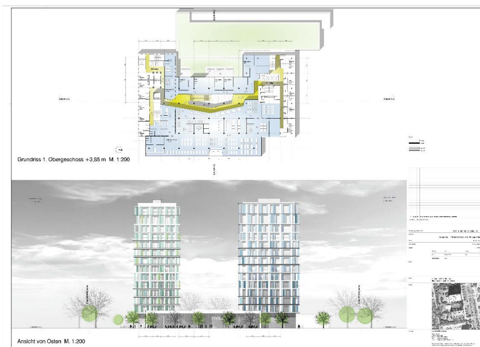
Abbildung aus Projekt 1.: Grundriss vom 1. OG und Modellansicht auf Wohn- und Geschäftshaus „Blue Tower“ in Frankfurt am Main (mit SPIRIT erstellt) Urheber: pWA/planwerkstatt.architekten, Furth im Wald